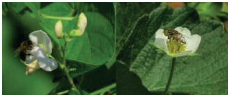
Figura 2. A la izquierda, una abeja de la miel visita una flor de judía verde y, a la derecha, un sírfido de la especie Eristalinus aeneus (polinizador silvestre) visita una flor de fresa.

La especie de polinizador comercial más usada a nivel mundial es la abeja de la miel ( Apis mellifera ). Probablemente es el animal manejado más abundante y extendido en el mundo. La abeja de la miel ha sido utilizada históricamente para la producción de miel y durante las últimas décadas también para la polinización de muchos cultivos. A pesar de la creciente preocupación por el estado de salud de sus poblaciones, al ser un animal manejado, el suministro de colmenas