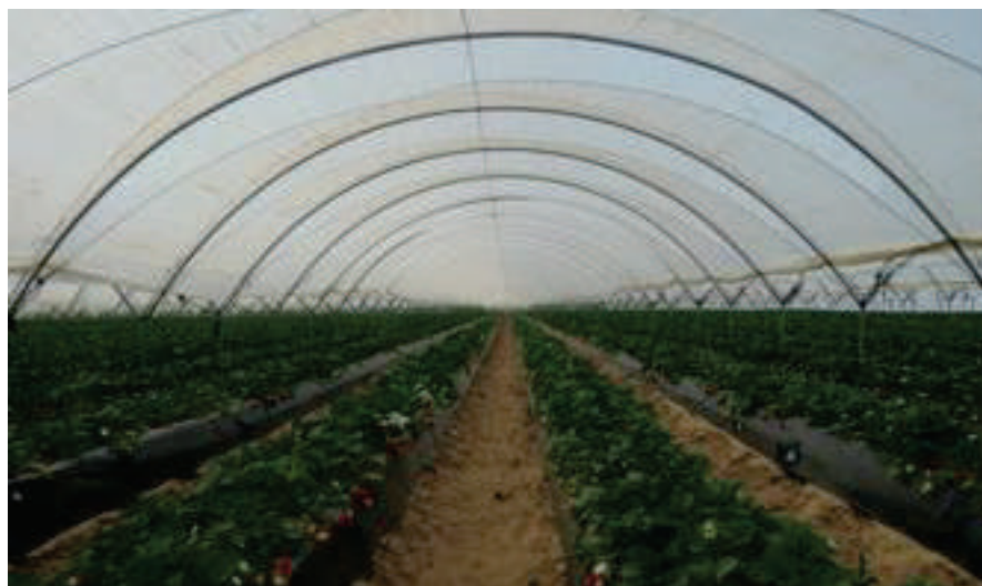
Figura 3. Cultivo de fresa bajo plástico en la provincia de Huelva.

En el caso de cultivos permeables para los polinizadores silvestres, tipo invernaderos abiertos por sus extremos y campos de cultivo, la eficacia de los polinizadores comerciales va a depender no solo de su propia identidad y la del cultivo, sino también de factores que medien la presencia de polinizadores silvestres. De hecho, el mayor rendimiento y calidad de la cosecha se suele relacionar con la abundancia y riqueza de polinizado-