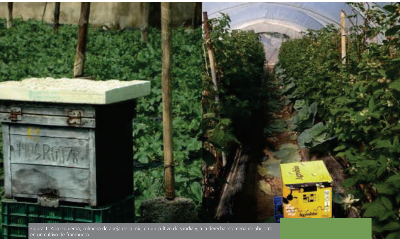
Figura 1. A la izquierda, colmena de abeja de la miel en un cultivo de sandía y, a la derecha, colmena de abejorro en un cultivo de frambuesa.